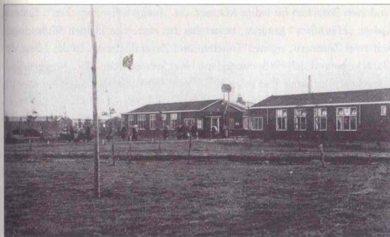
Abgehender Transport, polizeiliches Durchgangslager Westerbork

fünf Kilometer zur regulären Eisenbahnstrecke nach Hooghalen zu Fuß laufen. 13 In den Monaten August bis November 1942 war das Lager trotz der regelmäßigen Deportationen überfüllt, da ständig neue Transporte aus verschiedenen Städten der Niederlande eintrafen, die die Baracken nicht zu fassen vermochten. Die höchsten Belegungsstärken mit über 15 000 Menschen wurden vermutlich zwischen dem 3. und 5. Oktober 1942, als die Häftlinge der Räumungstransporte aus den „Jüdischen Arbeitslagern“ mit ihren Familienangehörigen aus Amsterdam – insgesamt 10 000 Menschen – eintrafen, 14 und im Juni 1943 erreicht, nachdem in Amsterdam am 25. Mai und 20. Juni Großrazzien auf der Suche nach den Mitgliedern des Judenrates durchgeführt worden waren. 15