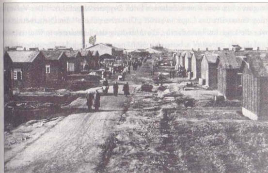
Polizeiliches Durchgangslager Westerbork – Boulevard des Misères

rium das Lager bei der Firma J. C. J. Knegt und Söhne im April 1941 gegen Brand der Kantinenvorräte versichern. Die Versicherung wurde ein Jahr später vom BdS übernommen, indem eine Police für das gesamte Lager auf 200 000 Gulden abgeschlossen wurde. 19