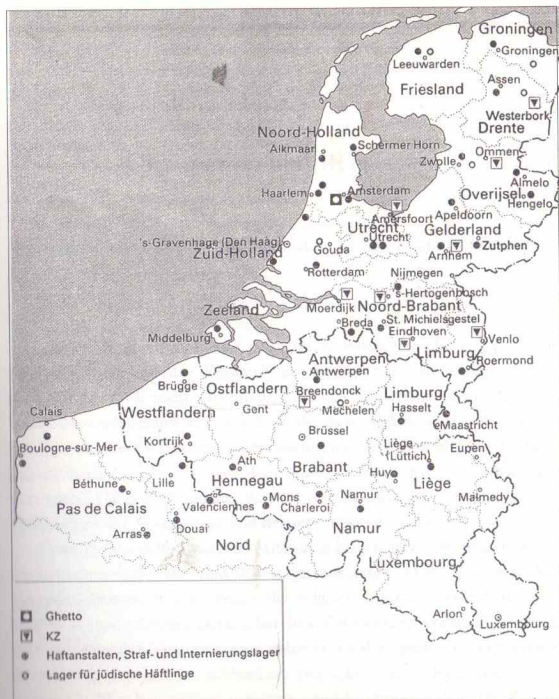
Orte des Terrors in den Niederlanden, Luxemburg, Belgien und Nordfrankreich