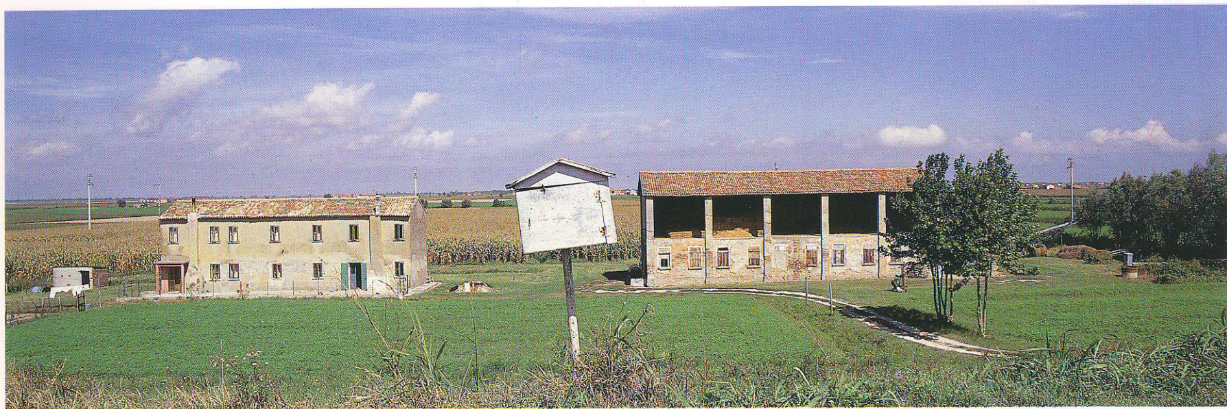
Verso la foce del Po, 1988. Toward the mouth of the Po, 1988.