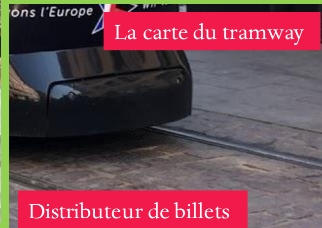
La carte du tramway