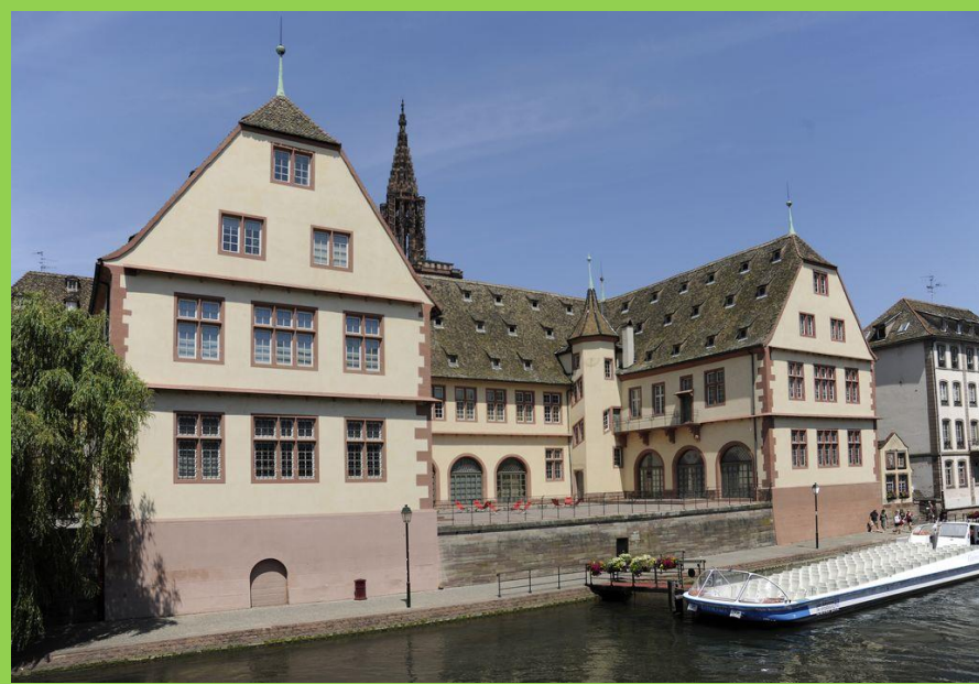
Musée alsacien de Strasbourg