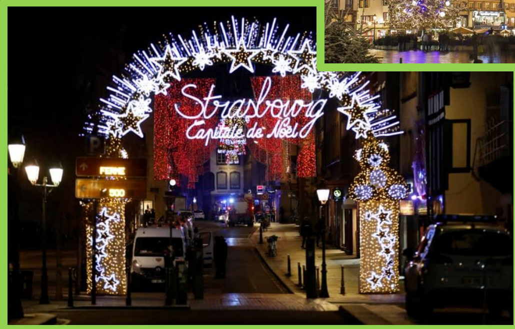
Le sapin de Noël à Place Kléber