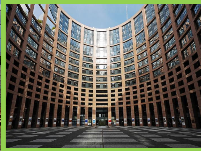
La cour du bâtiment