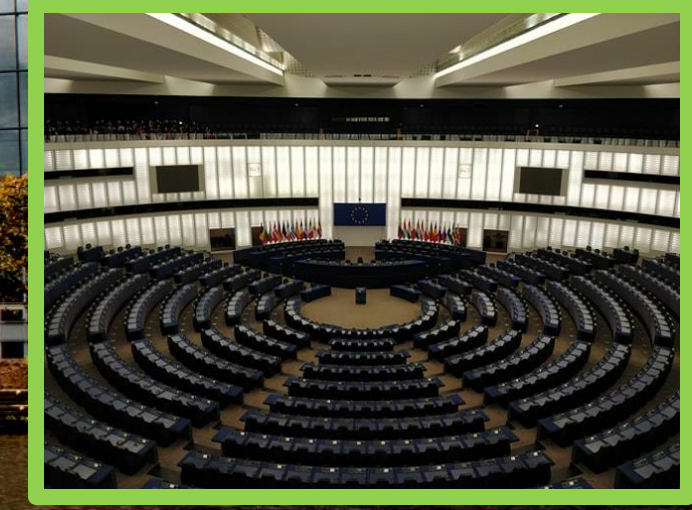
Salle de discussion centrale