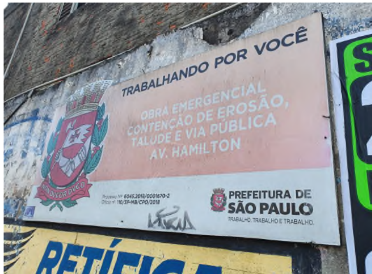
Placa informando sobre as obras