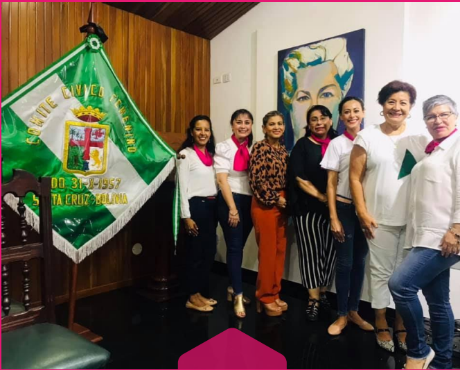
COMITÉ CIVICO FEMENINO

Así mismo buscamos establecer convenios y alianzas estratégicas con Instituciones públicas y privadas, que ejecutan proyectos relacionados al área de la ingeniería y con instituciones congéneres afines a la mujer.