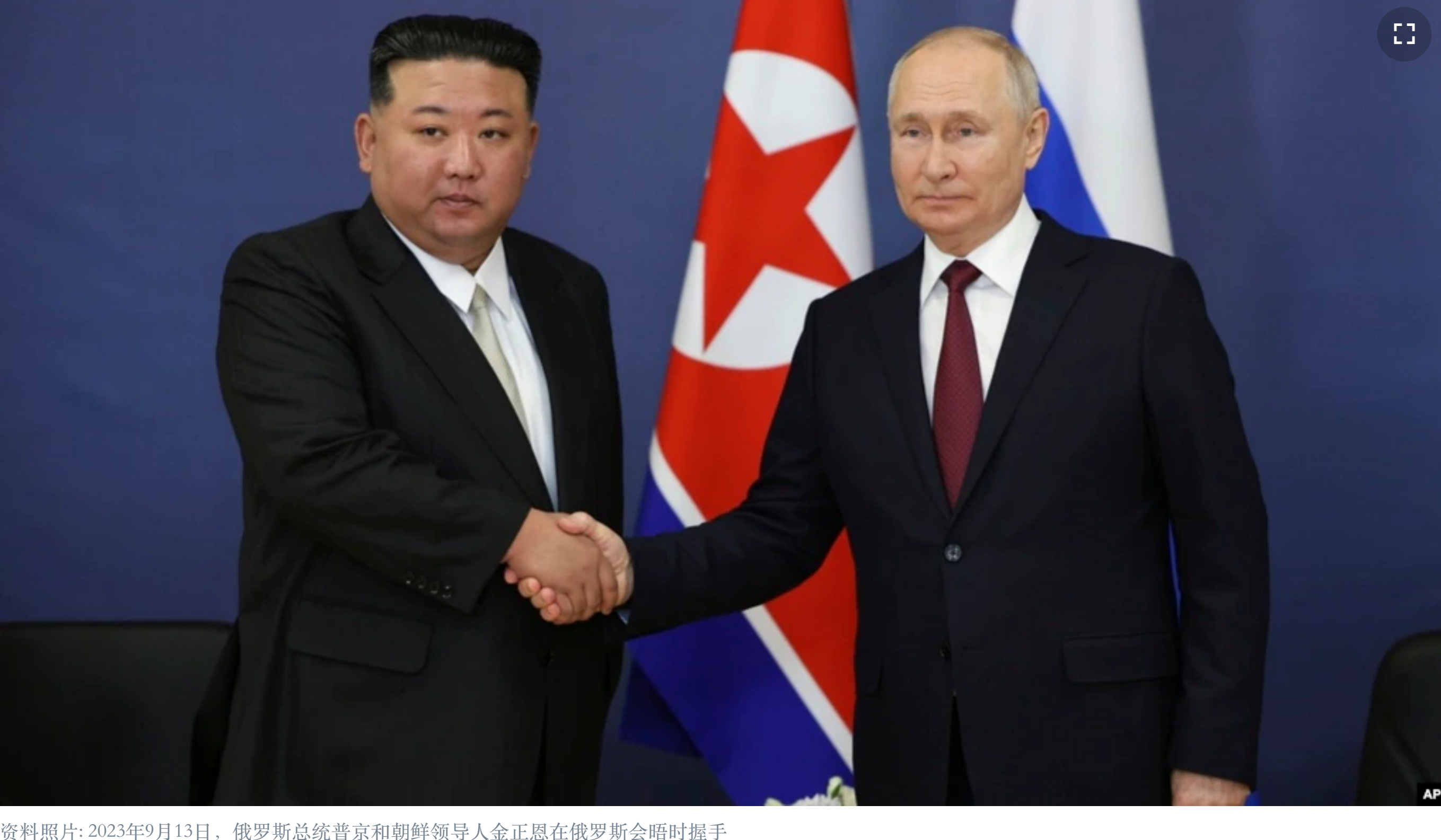
资料照片: 2023年9月13日, 俄罗斯总统普京和朝鲜领导人金正恩在俄罗斯会晤时握手

台北 — 日本外务省本星期发表的年度外交政策白皮书指出, 日本正面临着二战以来最严重和复杂的安全局势, 而挑战主要来自中国、朝鲜和俄罗斯。报告指出了朝鲜的导弹进展和俄罗斯对乌克兰的入侵, 但最强烈的批评还是针对中国。